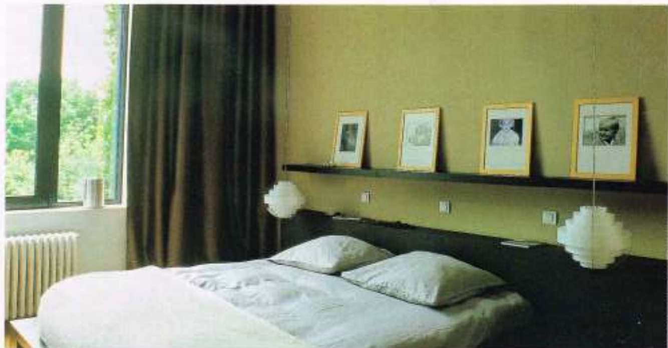
Dans la chambre des parents, lumière et sobriété ont été privilégiées. Lit et luminaires (Ikea), linge de lit (Descamps), plaid (Linum).

reste tout de même très actuelle grâce à l'installation d'une salle de bains attenante à chaque chambre. Au deuxième niveau, les 100 m 2 regroupant les trois chambres de bonne transformées en chambres d'amis, et un ancien séchoir aux grandes baies vitrées qui fait maintenant office d'atelier. Enfin, un vaste grenier sert de salle de jeux pour les trois petites filles ! Cette grande maison de ville est aujourd'hui si lumineuse et pratique que Valérie et son époux ont décidé de la louer pour des séances de photos professionnelles. Une manière aussi pour elle de faire connaître son travail de réhabilitation à une clientèle française et belge de plus en plus intéressée par ce type de réalisation. ■