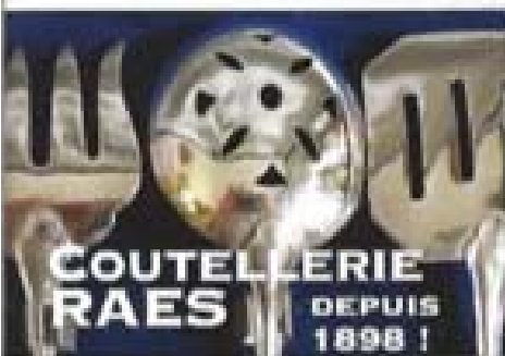
COUPELLERIE RAES DEPUIS 1898 !